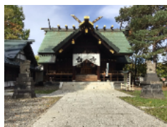
【写真⑦ 上川神社頓宮】

常磐公園にある「上川神社頓宮」は、旭川市民にとって大切な場所なので、私たちも、この神社を大事にしていきたいです。