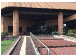
【写真⑤ 北海道立旭川美術館】