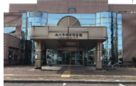
【写真④ 旭川市中央図書館】

みなさん、常磐公園に足を運んだときには、旭川市中央図書館と北海道立旭川美術館に立ち寄ってみてください。