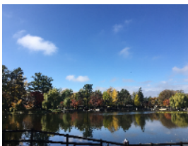
【写真⑥ 常磐公園の美しい自然】