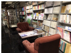
【写真② 旭川文学資料館】